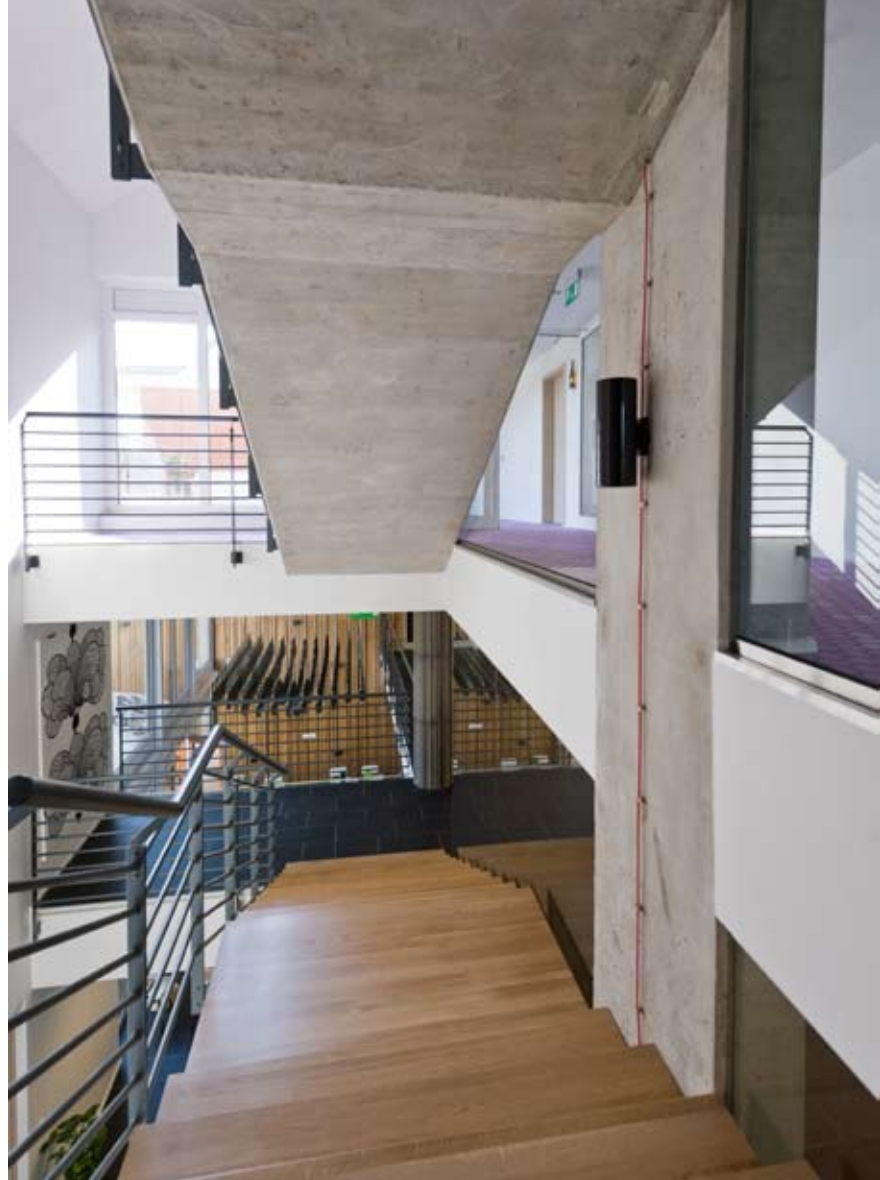
Fény és látvány – áttekinthető struktúra