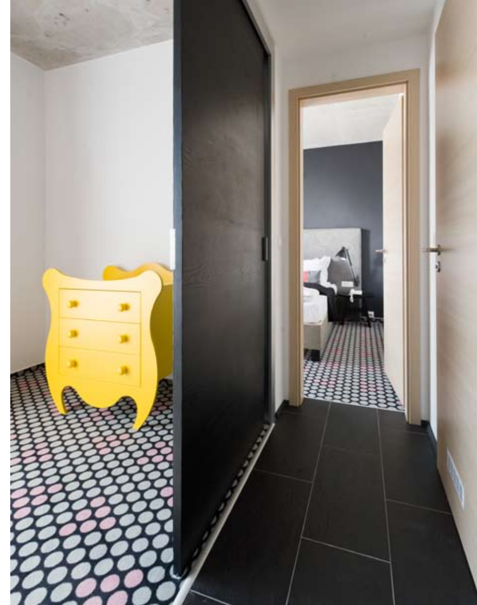
Nem szokványosak a szobák sem – sárga bútor, nyersbeton mennyezet