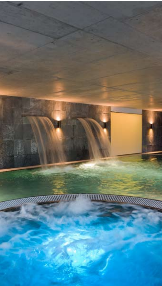
Pezsgőfürdő pezsgővel a legjobb