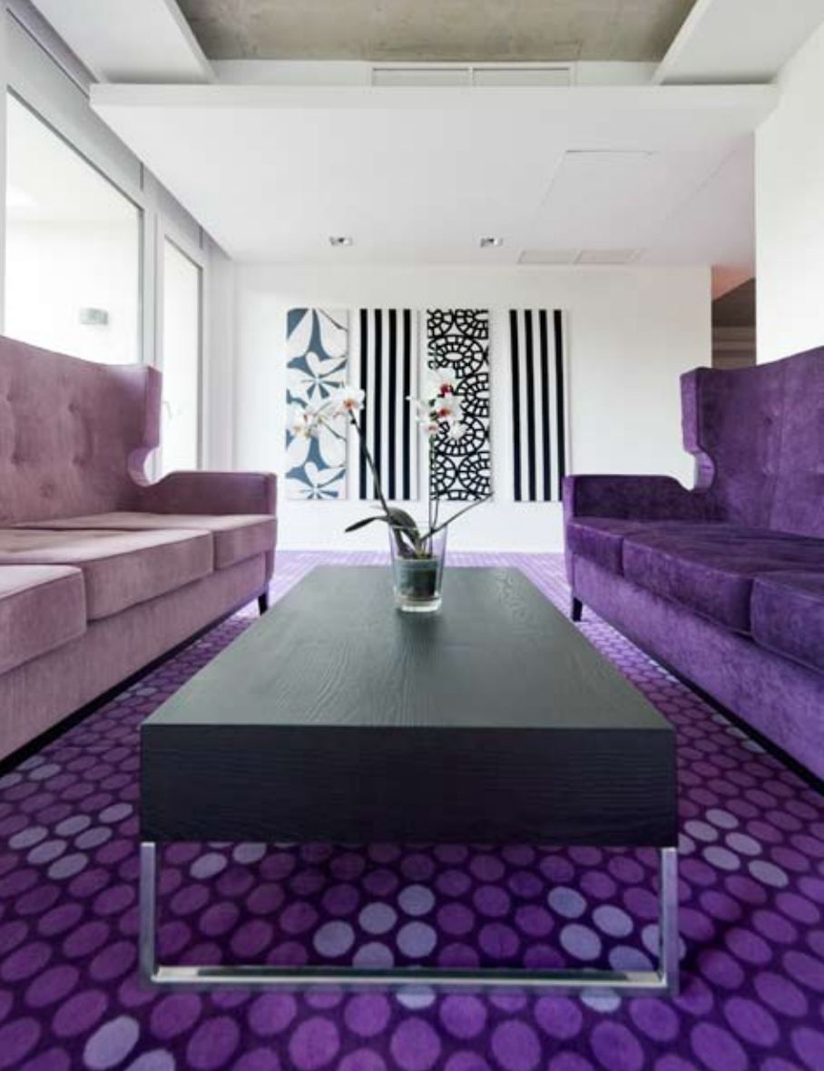
Lépten-nyomon meghökkenítő térrészekre bukkanunk