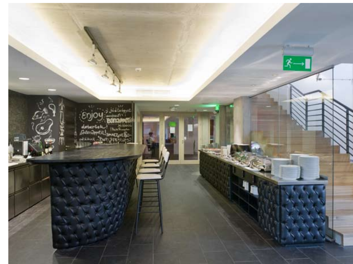
A bárnak érzéki bőrrel bevont pultok adnak hangulatot

A Bonvino tervezői is ilyen emberek. Nem néztek körül, és úgy tettek, mintha minden a legnagyobb rendben lenne. Mintha az a kedves, közvetlen és szofisztikált belsőépítészeti (egyszersmind kommunikációs) program, amellyel a ház vendégei számára értelmezik, s teszik átélhetővé a nagymúltú borvidéket, nem a fehér holló kategóriába tartozna errefelé. A hotelt, ha külső