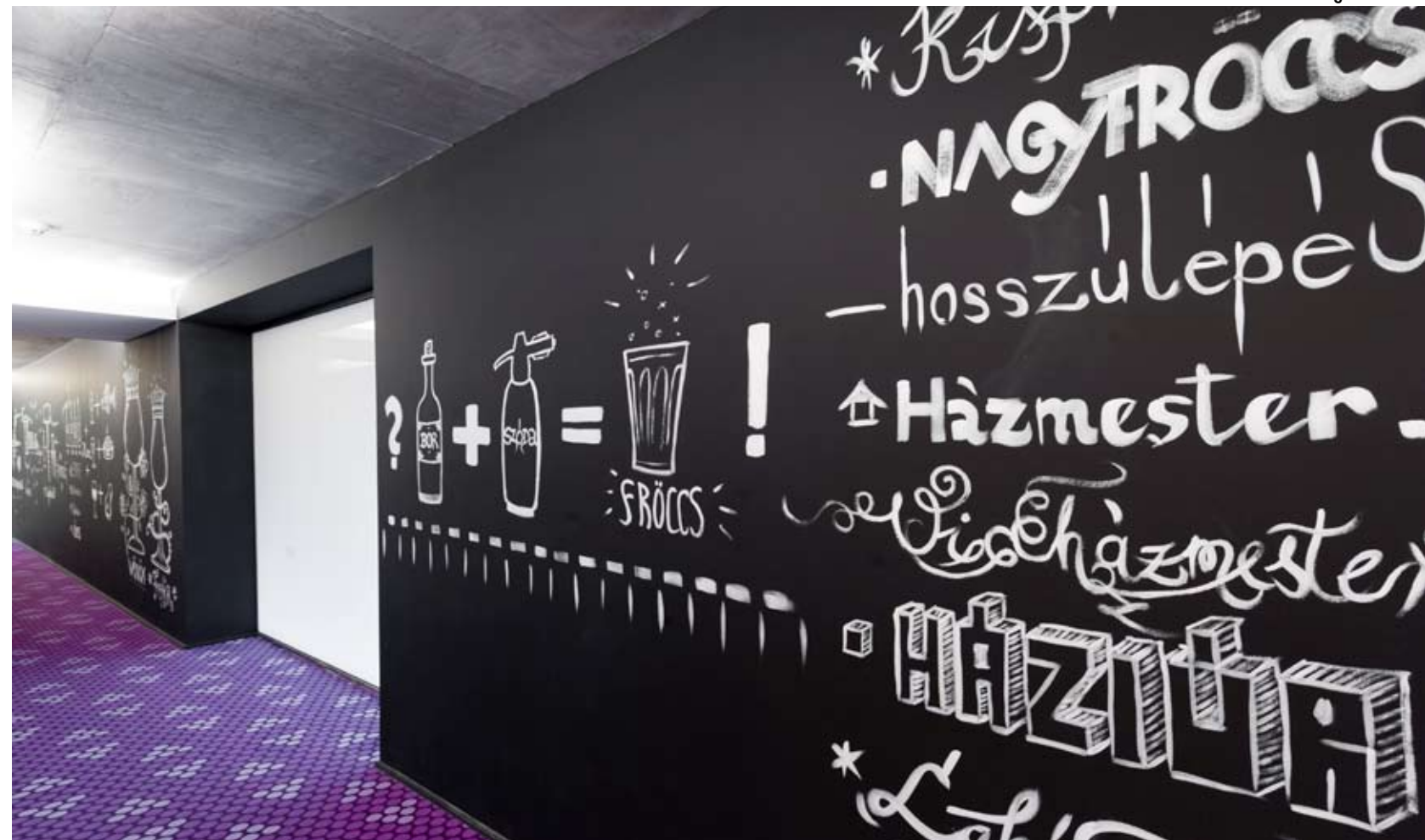
Amikor a kommunikáció is a design része

MINDEN INGATLANFEJLESZTÉS HÁRMAS ALAPIGAZSÁGRA ÉPÜL: 1.) LOKÁCIÓ, 2.) LOKÁCIÓ, 3.) LOKÁCIÓ. NAGY KÉRDÉS TEHÁT, HOGY A BONVINO ELHELYEZKEDÉSE SZERENCÉS VÁLASZTÁSNAK, VAGY HOSSZÚ TÁVRA ELŐRELÁTO DÖNTÉSNEK BIZONYULÉ?