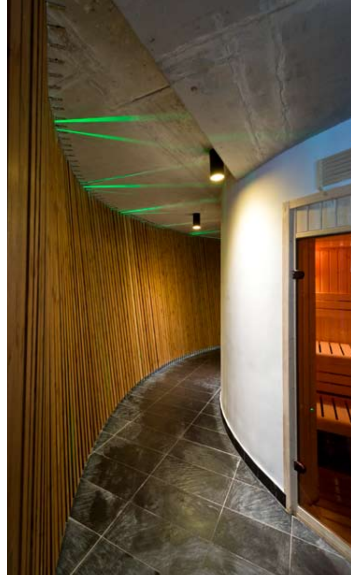
A wellness részleg íves folyosójú bejárata